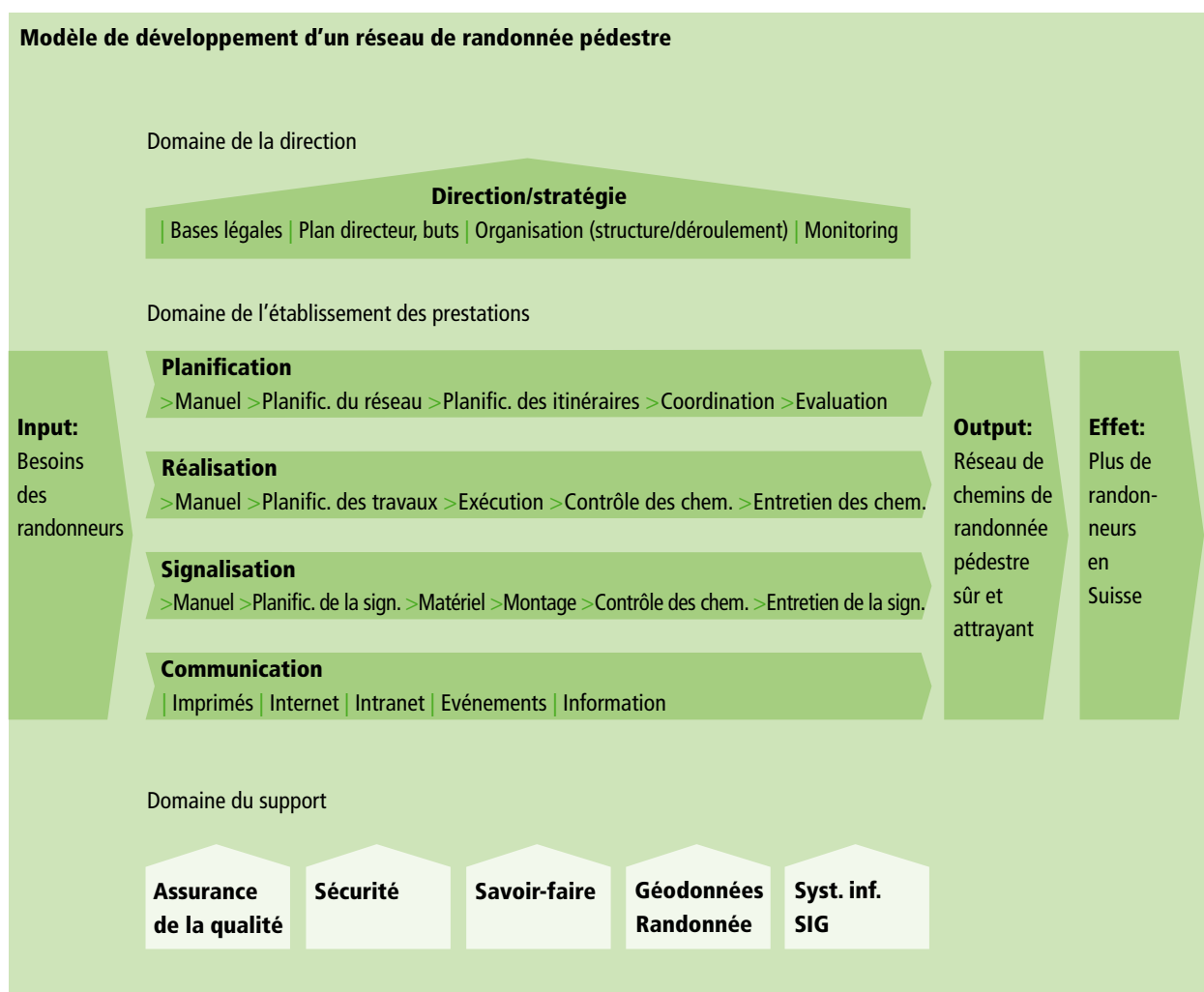
Fig. 1 Processus de fourniture de prestations dans un système de randonnée pédestre axé sur la qualité.

Les présents objectifs de qualité ont été élaborés par Suisse Rando sur mandat de l'Office fédéral des routes (OFROU) et en collaboration avec la direction du projet SuisseMobile. Les objectifs de qualité ont été discutés et consolidés dans le cadre d'une procédure d'audition avec les associations et services cantonaux des chemins de randonnée pédestre. Les « Objectifs de