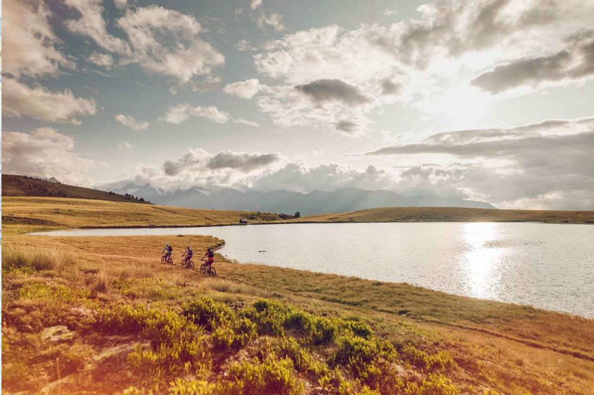
Fantastische Aussichten auf der Valais Alpine Bike.

für die Kickoffs sind die Arbeitshilfe Velonetzplanung, welche von der Velokonferenz Schweiz im Auftrag des Bundesamts für Strassen (ASTRA) erarbeitet wird, in enger Zusammenarbeit mit SchweizMobil, sowie das Faktenblatt zum Thema Zielgruppen im Veloland Schweiz. Beide Grundlagen sollen bis Ende des Jahres herausgegeben werden.