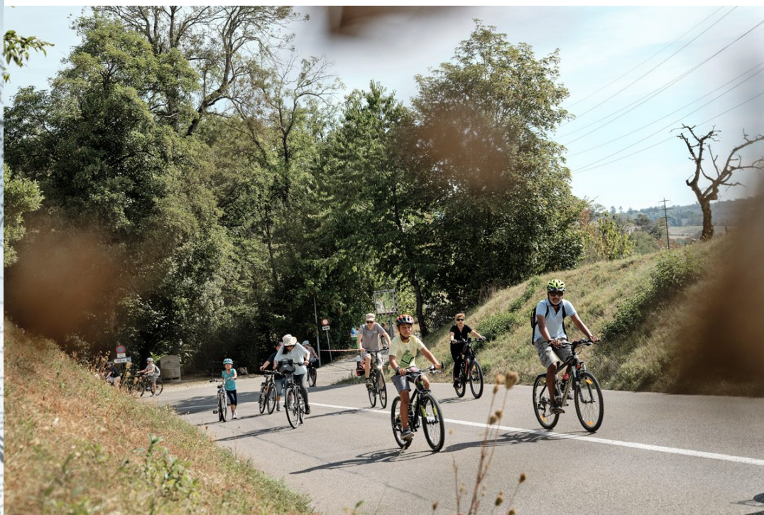
slowUp Lac de Morat

de correspondre au mieux au balisage sur place. Merci à tous les partenaires pour l'excellente collaboration et que le début de la saison soit un succès.